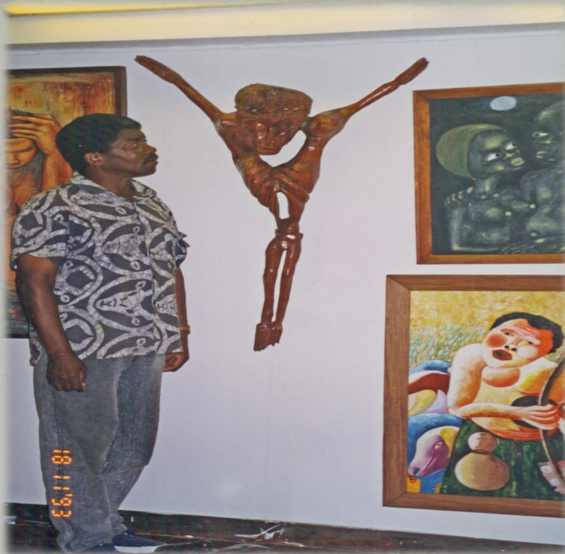
A arte e a religiosidade do escultor Chissano