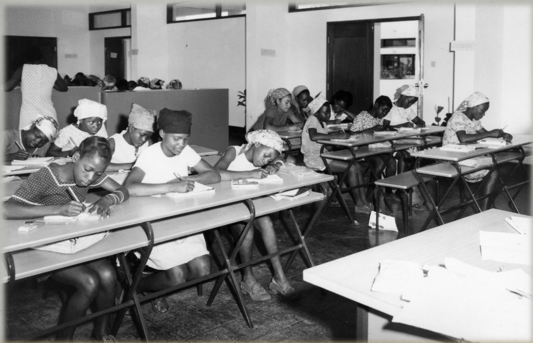
As escolas em Moçambique