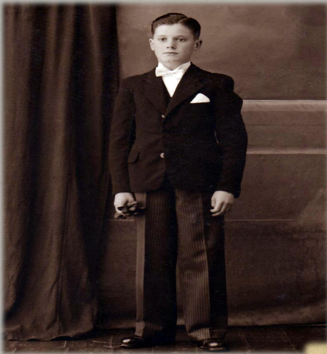
A comunhão solene em 28 de março de 1937