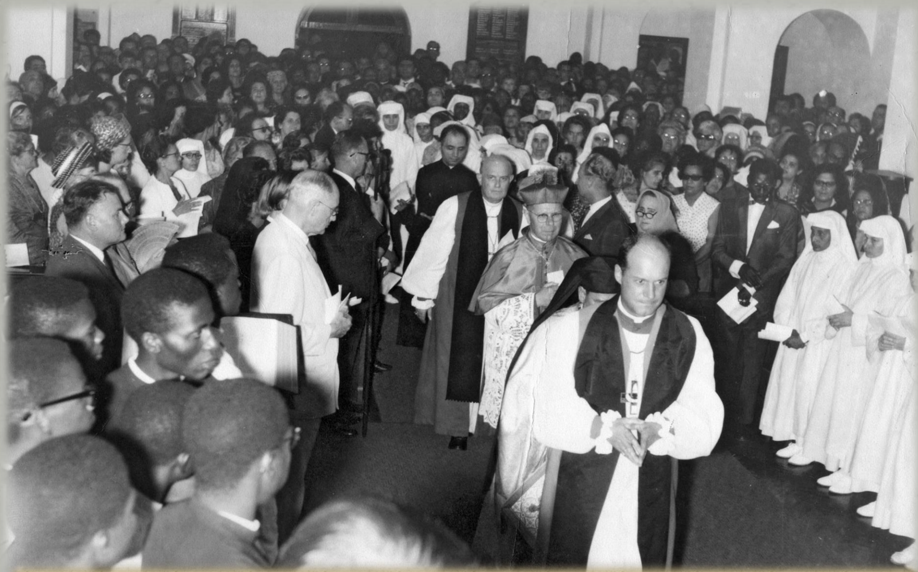
Cerimónia ecuménica nos Libombos