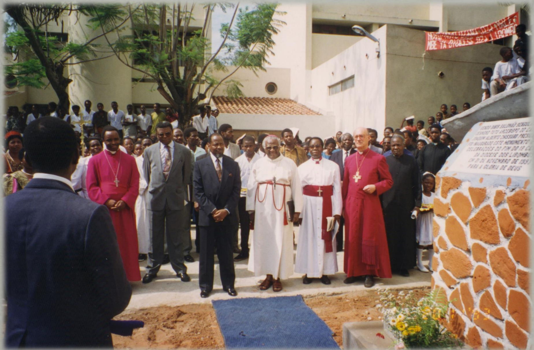
Visita de Joaquim Chissano e Desmond Tutu à igreja de S. Cipriano de Chamanculo em 1993