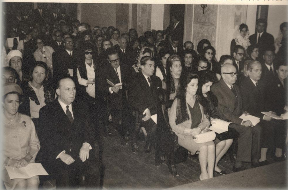
Professor Marcello Caetano na cerimónia de sagração de D. Daniel