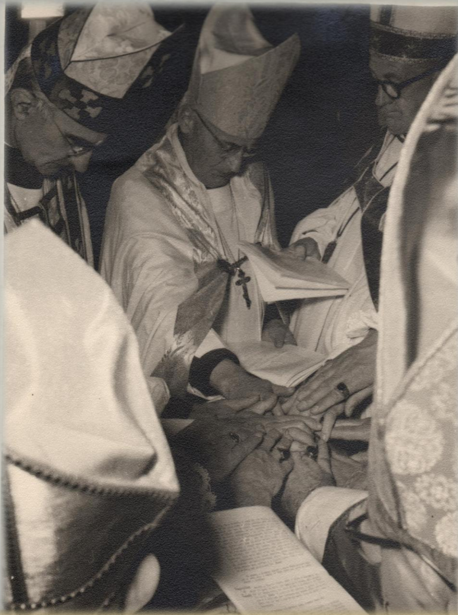
Sagração de D. Daniel na Catedral de S. Paulo (Lisboa) em 25 de maio de 1967