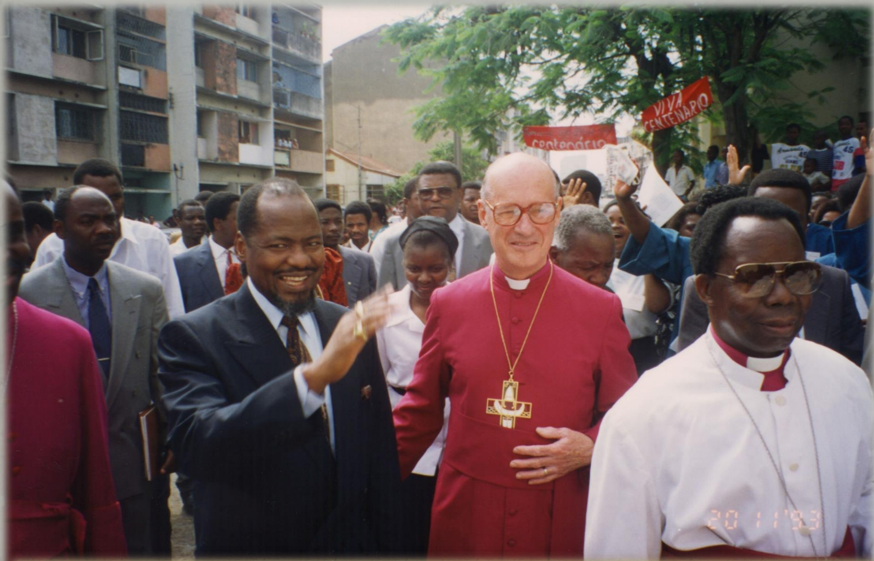
Visita do Presidente da República de Moçambique Joaquim Chissano em 1993