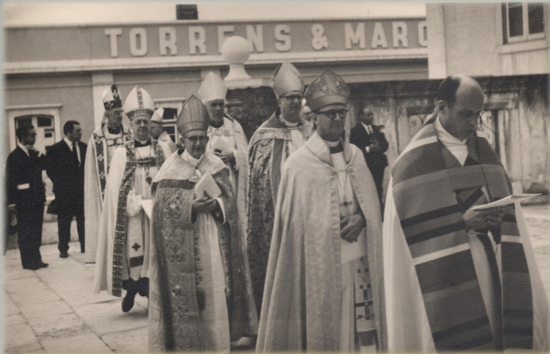
Sagração de D. Daniel na Catedral de S. Paulo (Lisboa) em 25 de maio de 1967