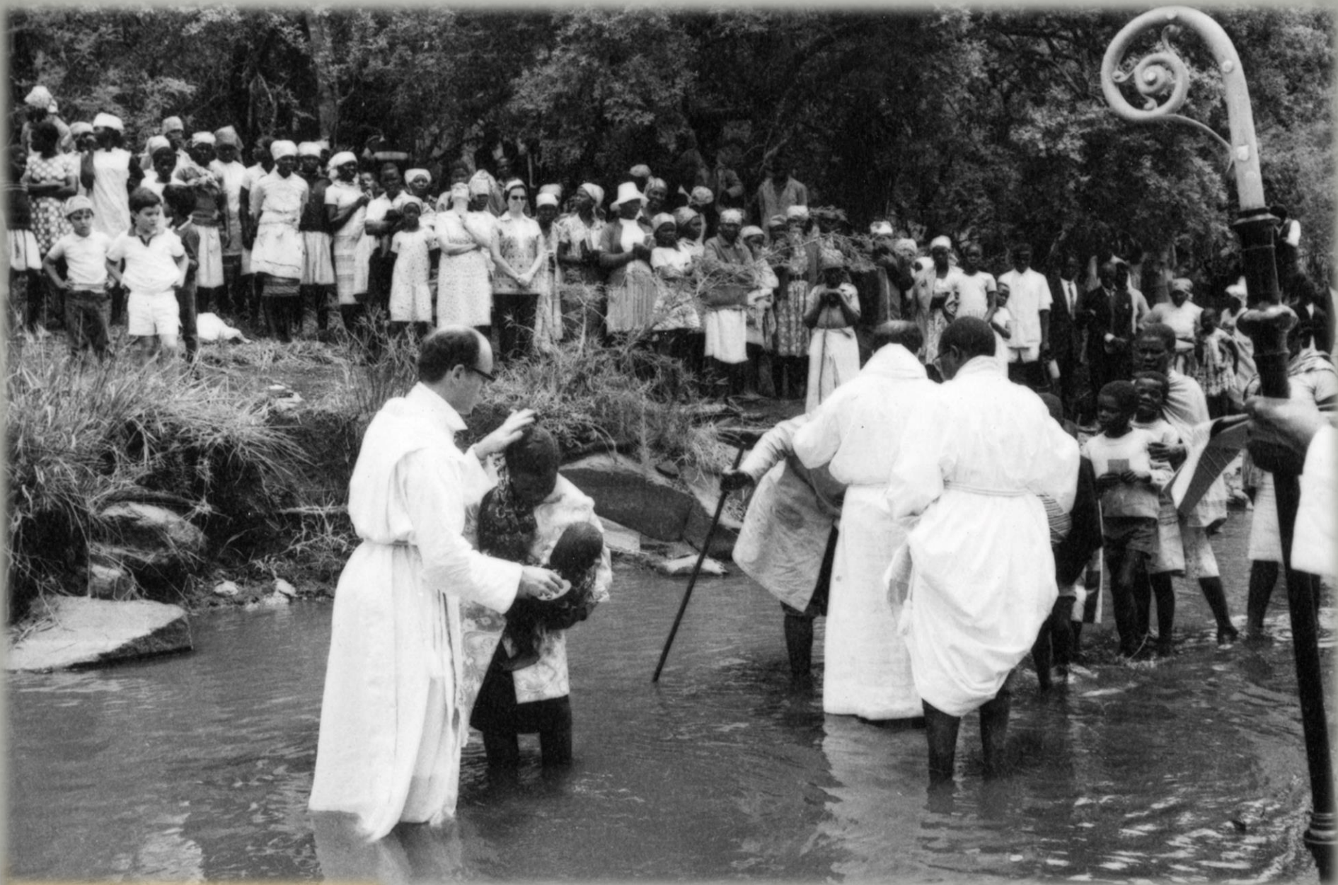
Cerimónia de Batismo