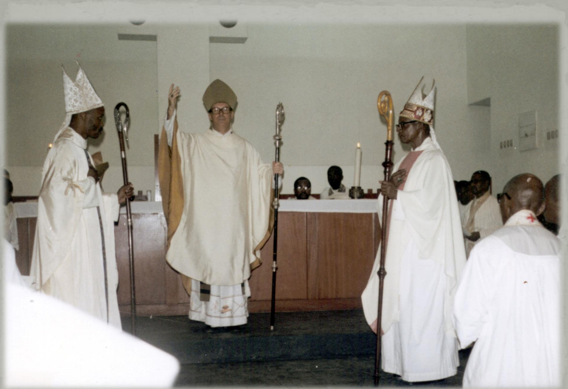
A última cerimónia nos Libombos