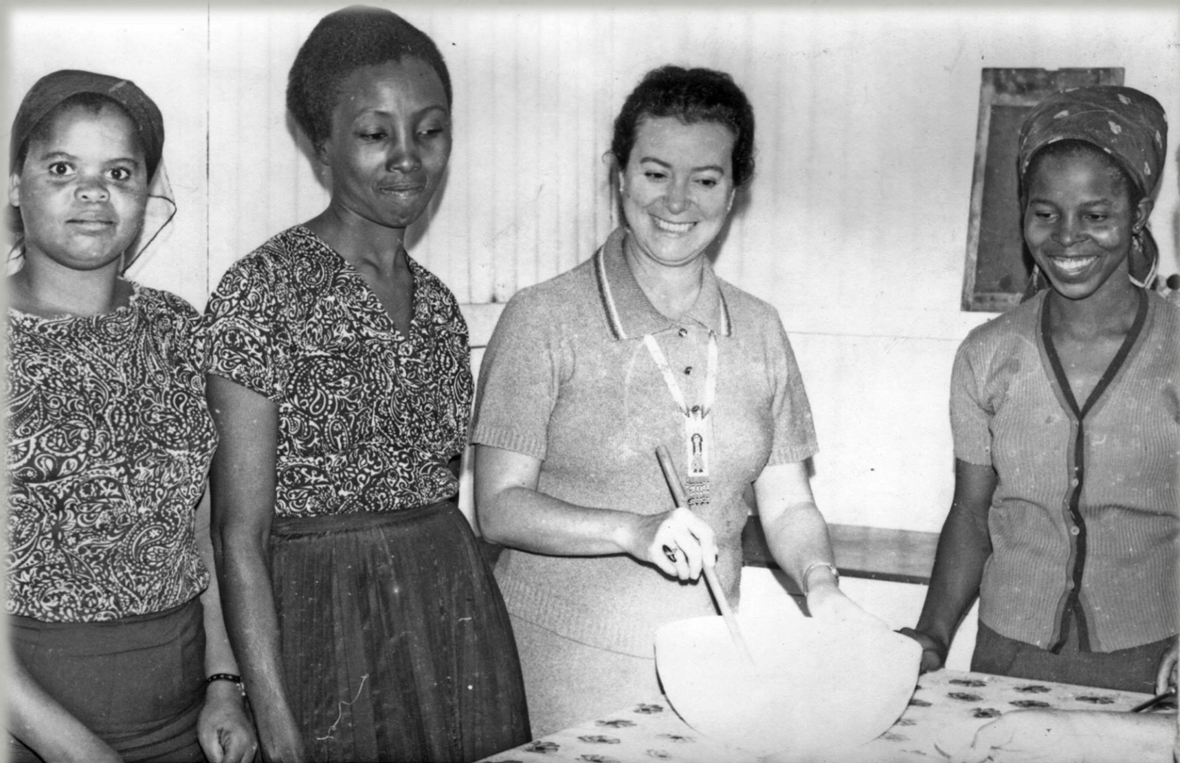
Trabalhos nas escolas em Moçambique