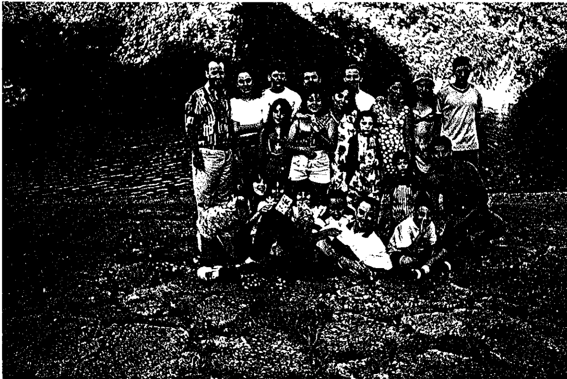
Um grupo de excursionistas da Paróquia do Prado, nos Arcos de Valdevez