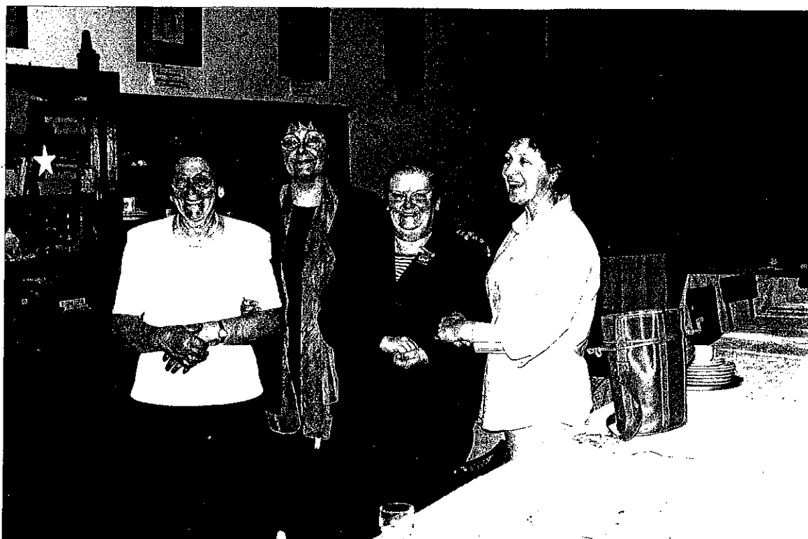
Membros da Sociedade de Senhoras da Igreja do Prado