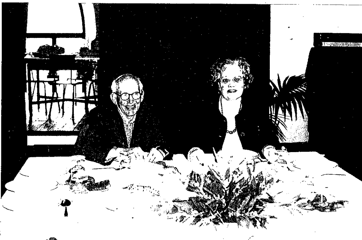
O sócio mais antigo do E. C. do Prado e também fundador