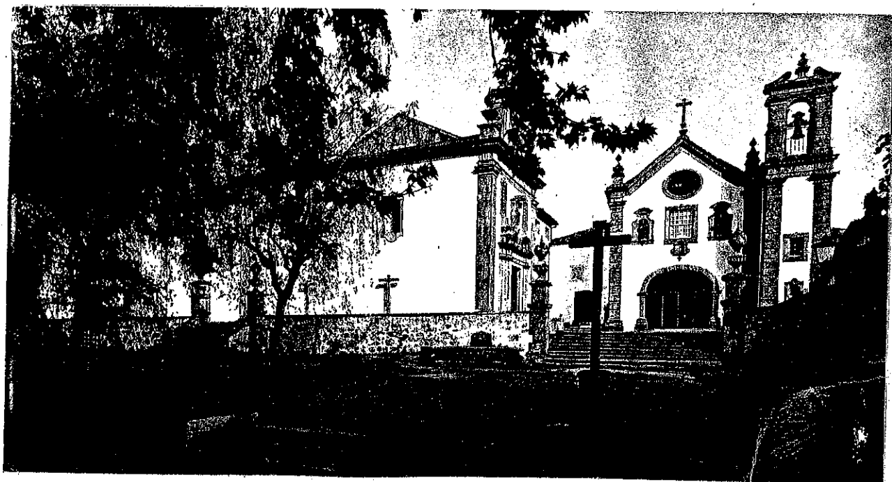
PONTE DE LIMA - Museu dos Terceiros

(De «La Luz» - Boletim da Igreja Espanhola Reformada Episcopal - Maio/Junho-1979)