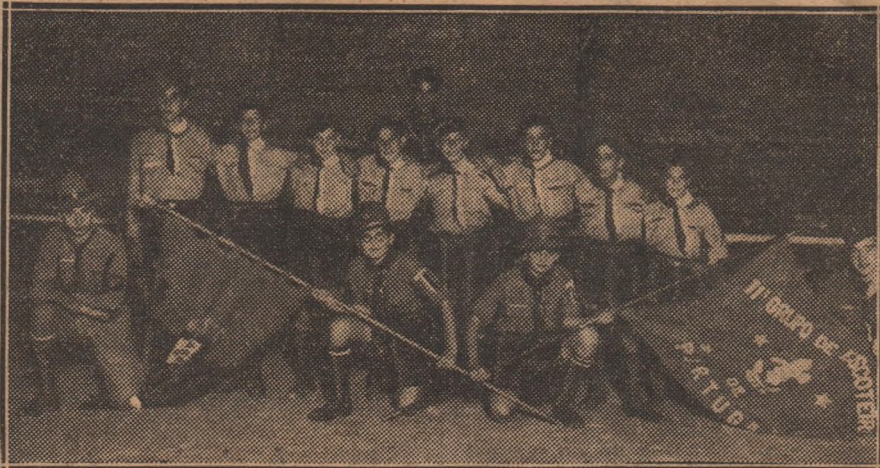
Os escoteiros do Grupo Sport Lisboa e Benfica

Ontem, á noite, na sede do Sport Lisboa e Benfica, na avenida Gomes Pereira, inaugurou-se um grupo de escoteiros, privativo daquela prestigiosa agremiação desportiva.